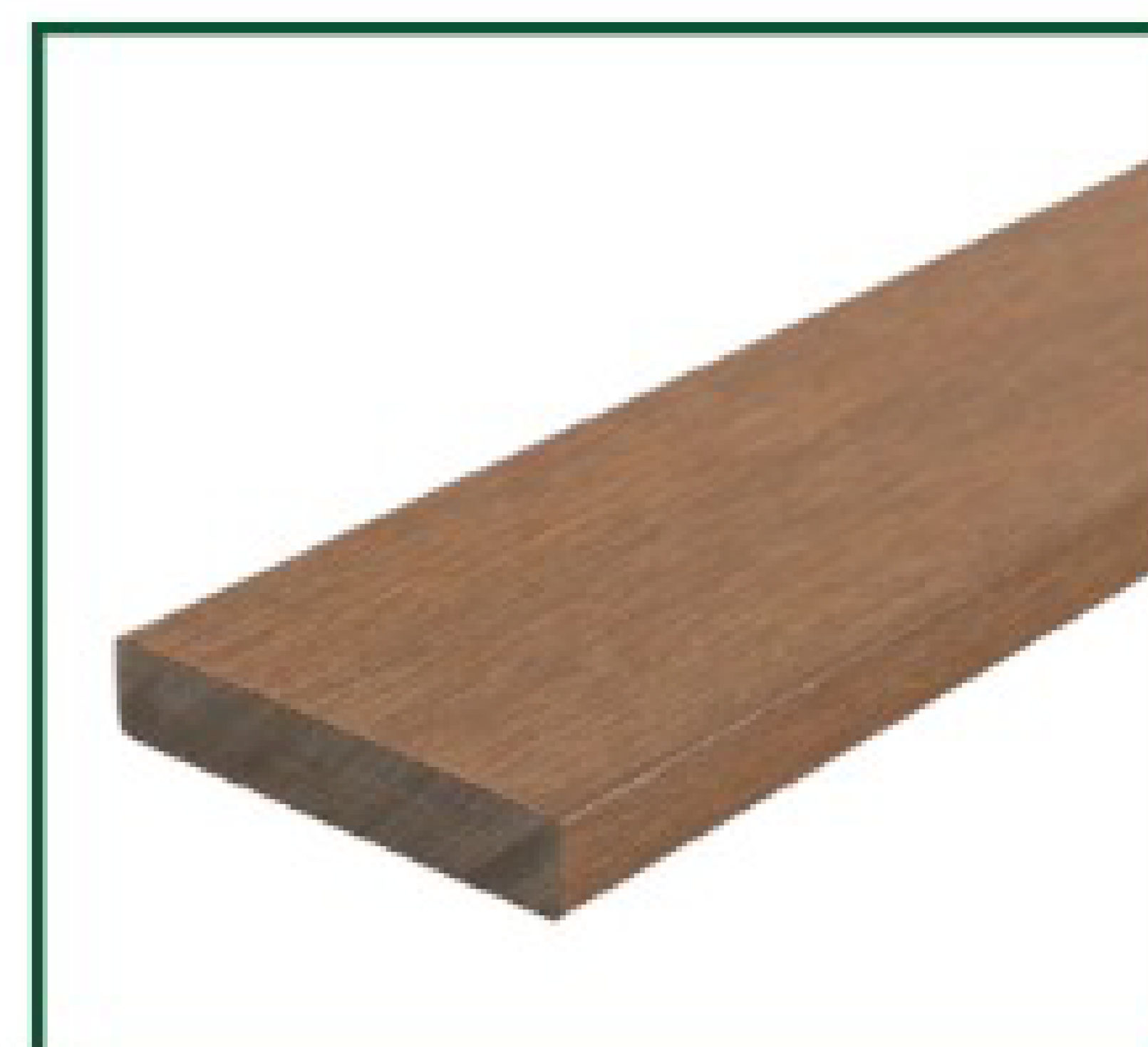
Tabla compuesta de 95% de materiales reciclados de polietileno de alta densidad y fibras de madera. Interior sólido. Textura: H1/H1