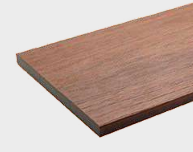
Pieza de terminación US06