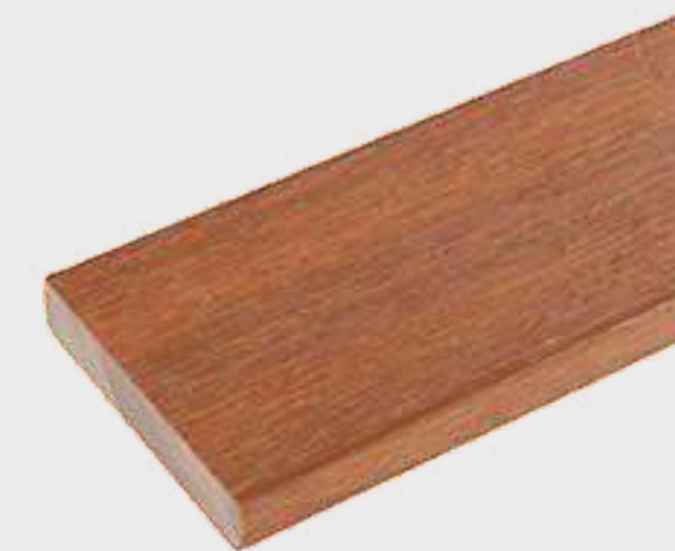
Pieza de terminación US17