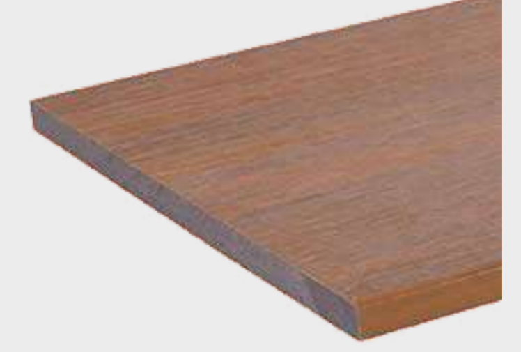
Pieza de terminación US05