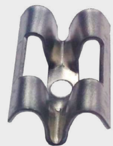
Clip de acero COBRA 21