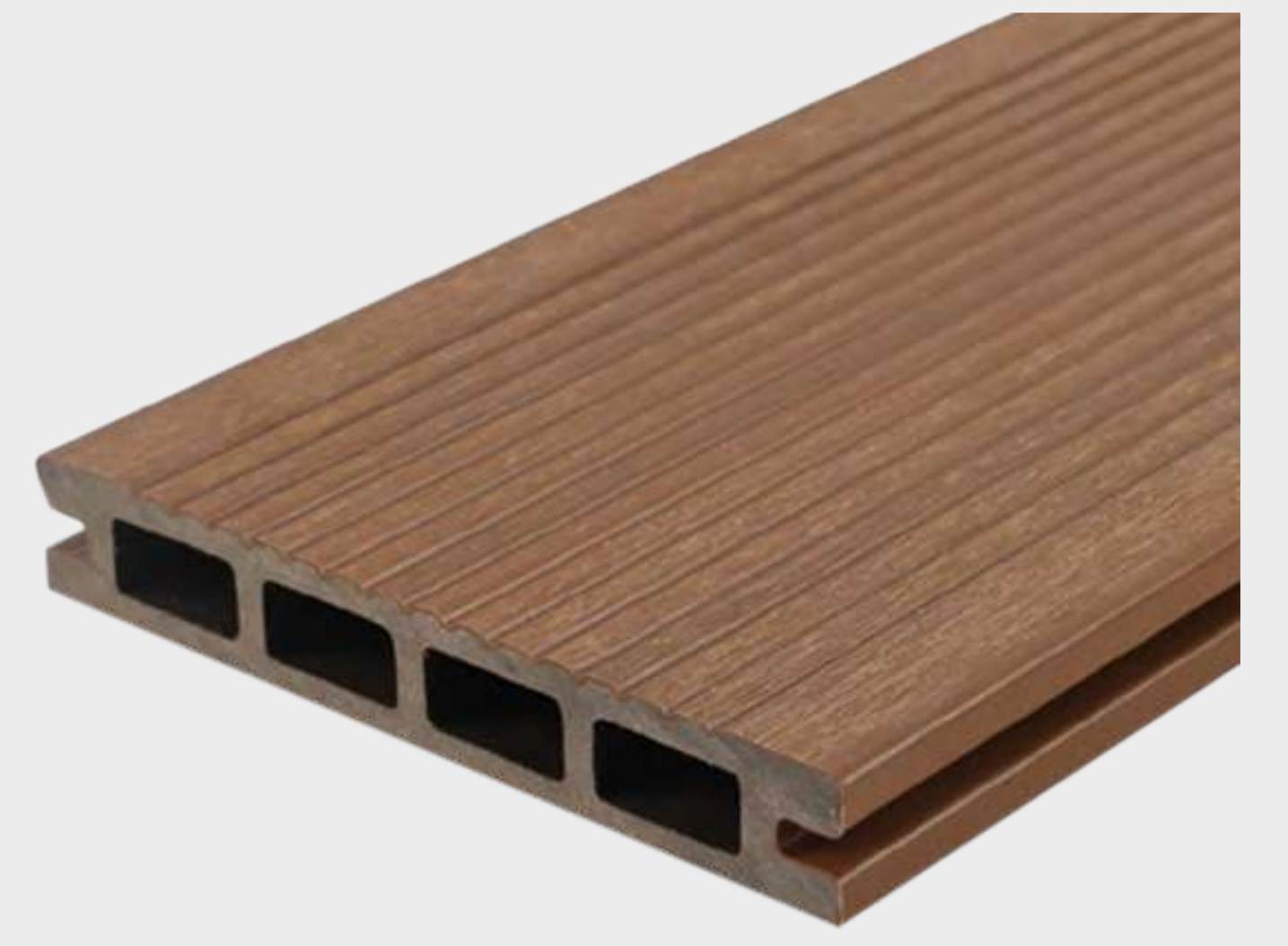
Tabla compuesta de 95% de materiales reciclados de polietileno de alta densidad y fibras de madera. Interior hueco.