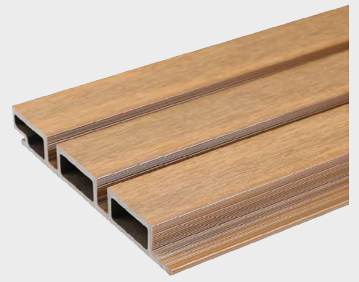
Tabla compuesta de 95% de materiales reciclados de polietileno de alta densidad y fibras de madera. Interior hueco.