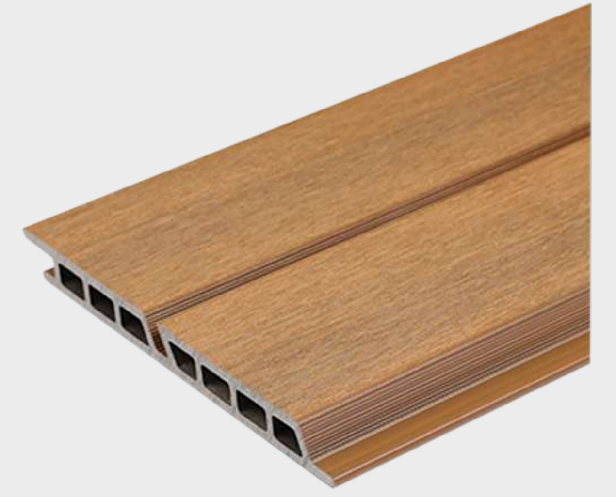
Tabla compuesta de 95% de materiales reciclados de polietileno de alta densidad y fibras de madera. Interior hueco.